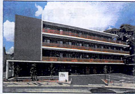
障害者支援施設 希望舎