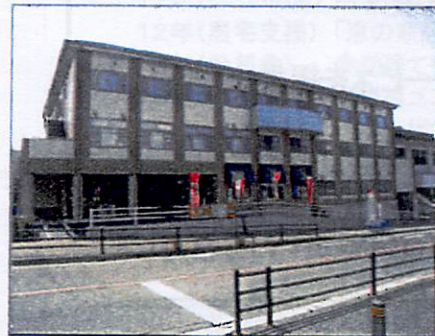
総合福祉施設 更生会ふれ愛の郷