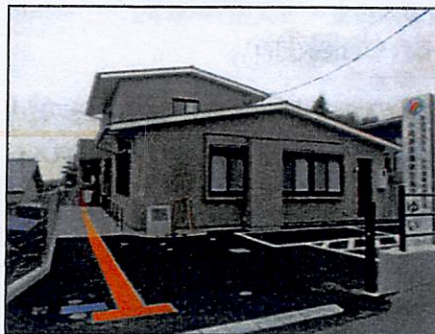
小規模多機能型居宅介護事業所 ゆい