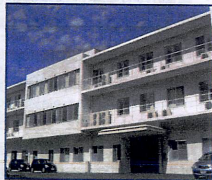
介護老人保健施設 更生会にじの郷