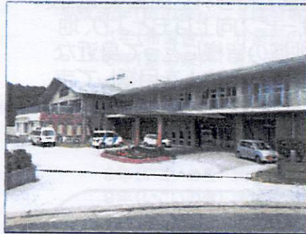
特別養護老人ホーム 恵の家