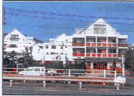
児童養護施設 報恩母の家